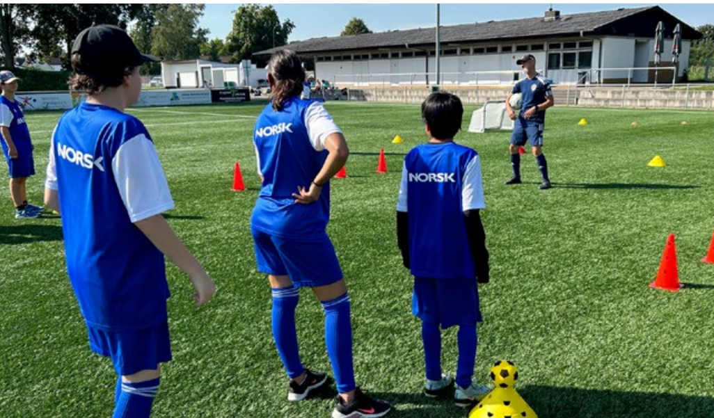
Viele tolle Trainingsstationen gab es beim Förderschulencamp in Klein-Krotzenburg.

Vom 11. bis 12. September war die Fußballschule des Hessischen Behinderten- und Rehabilitations-Sportverbands zu Gast bei der SG Germania Klein-Krotzenburg, um mit 30 Kindern aus zwei Förderschulen zwei intensive Tage mit viel Spaß am und mit dem Ball zu gestalten. Neben strahlendem Sonnenschein und einem gepflegten Sportgelände sorgten vor allem die Schülerinnen und Schüler der Frida-Kahlo-Schule aus Bruchköbel und der Friedrich-Fröbel-Schule aus Maintal mit ihrer engagierten Teilnahme am Training für eine schöne Zeit.