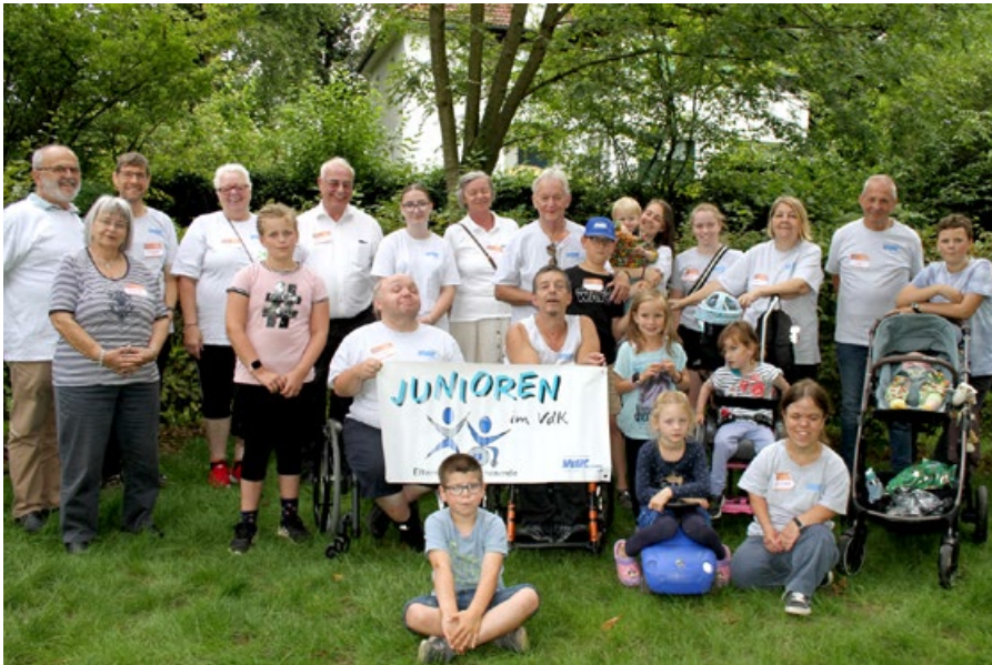
Eine schöne Familie: Eltern und Kinder, Betreuerinnen und Betreuer hatten Spaß beim inklusiven VdK-Wochenende in Bad Homburg.

Das inklusive Eltern-Kind-Wochenende des VdK war für alle Beteiligten ein wunderbares Erlebnis